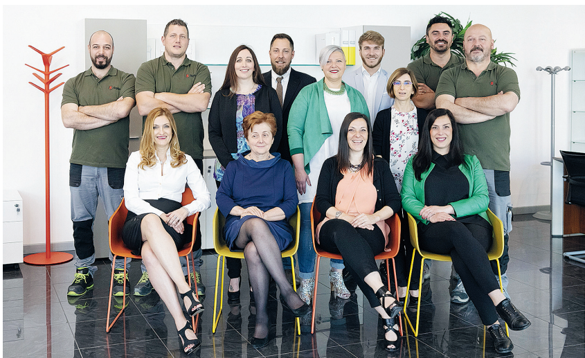
La nuova campagna pubblicitaria della Supino. Qui a destra il team Supino