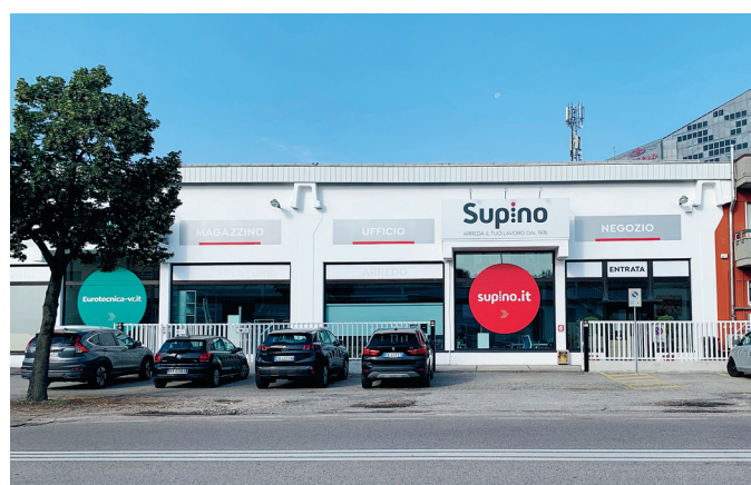
Le due sedi della Supino. A sinistra quella di Mantova, a destra quella di Verona